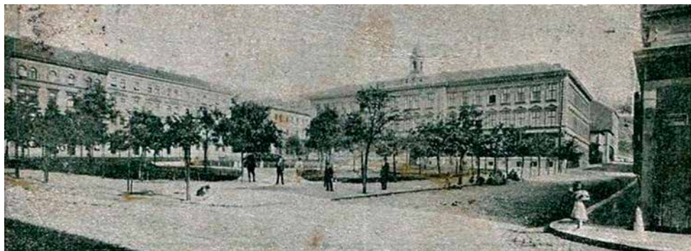
Komenského náměstí na přelomu století