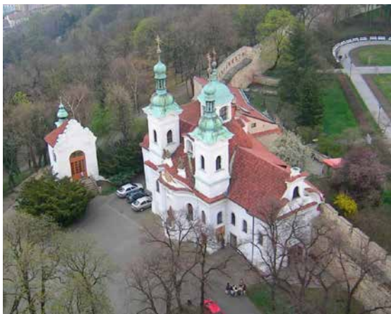
Tak vypadala naše katedrála v roce 2005.