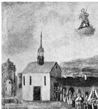
Kostelík svatého Vavřince – 30. léta 18. století.

Prostý text, provázený tklivou, melancholickou melodií, prošel tradicí starých tet a dospěl až k mojí matce, která mi zpívala zvláště tu píseň kdysi dávno, za slunného jarního podvečera na cestě, která se vine podél Hladové zdi od Strahova k vrcholu Petřína. Tehdy jsem nevěděl nic, že už před sedmi staletími