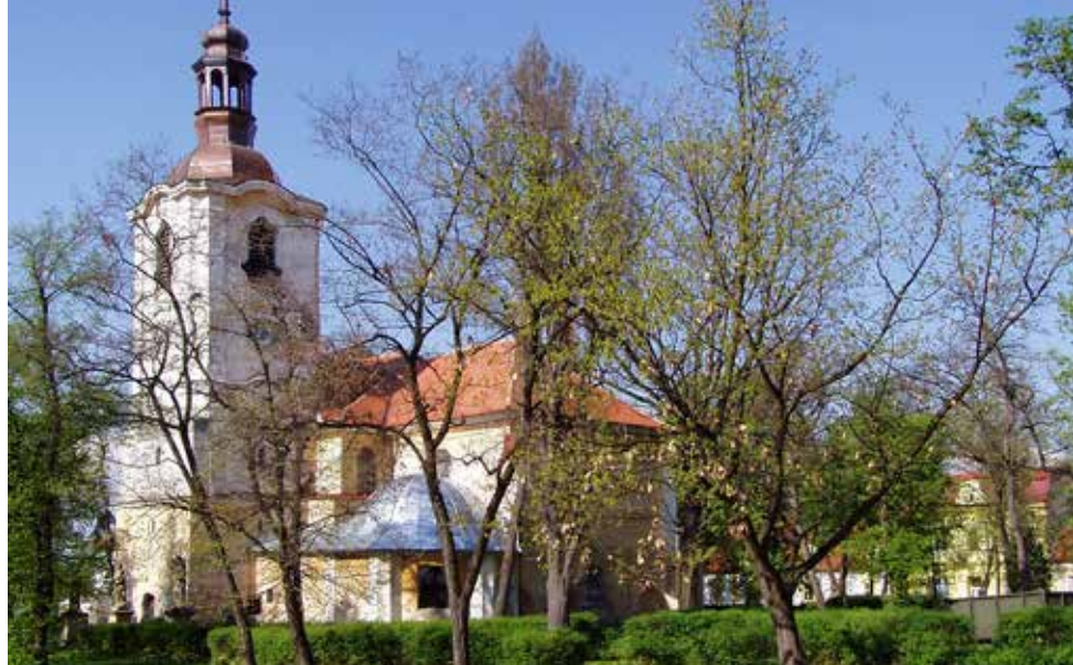
Liběšice byly Iškovou poslední římskokatolickou štací