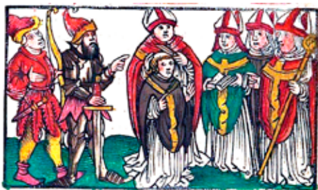
Hus je obřadně zभावován kněžských hodností. Kolorovaný dřevorez z knihy Processus consistorialis M. Ioh. Hus tištěné ve Štrasburku roku 1525.

má klidný vyrovnaný výraz vyjadřující pevné vnitřní přesvědčení, jeho kacířská čepice je nyní nikoli symbolem pohany, ale atributem jeho svatého mučednictví, jak jej uctívala česká utrakvistická církev. Podobné pojetí Husa se nachází na figurce z kamenného tábořského městského znaku z doby kolem roku 1517. Na oltářní desce z Vlíněvsí, která vznikla po roce 1510, je Jan Hus vyobrazen spolu se sv. biskupem Vojtěchem, duchovním nositelem české státnosti a patronem pražského arcibiskupství, při společném slavení Večeře Páně s velkým kalichem. Třetí dochovaná desková malba s Janem Husem pochází z Chrudimi a Hus je na ní zobrazen jako svatý kněz žehnající kalich ve společnosti sv. Václava, sv. Jeronýma Pražského a sv. Prokopa. Ve vzácném Jenském kodexu z poslední třetiny 15. stol., bohatě iluminovaném Janičkem Zmilelým z Písku, je Hus znázorněn jako kazatel pravdy a jako mučedník na hranici, tentokrát netypicky s plnovousem, jenž by mohl znamenat připodobnění mučedníka k utrpení Kristovu. Do kodexu je vevázán tištěný dodatek, kde nacházíme dřevorez s Husovým upálením se svatozáří.