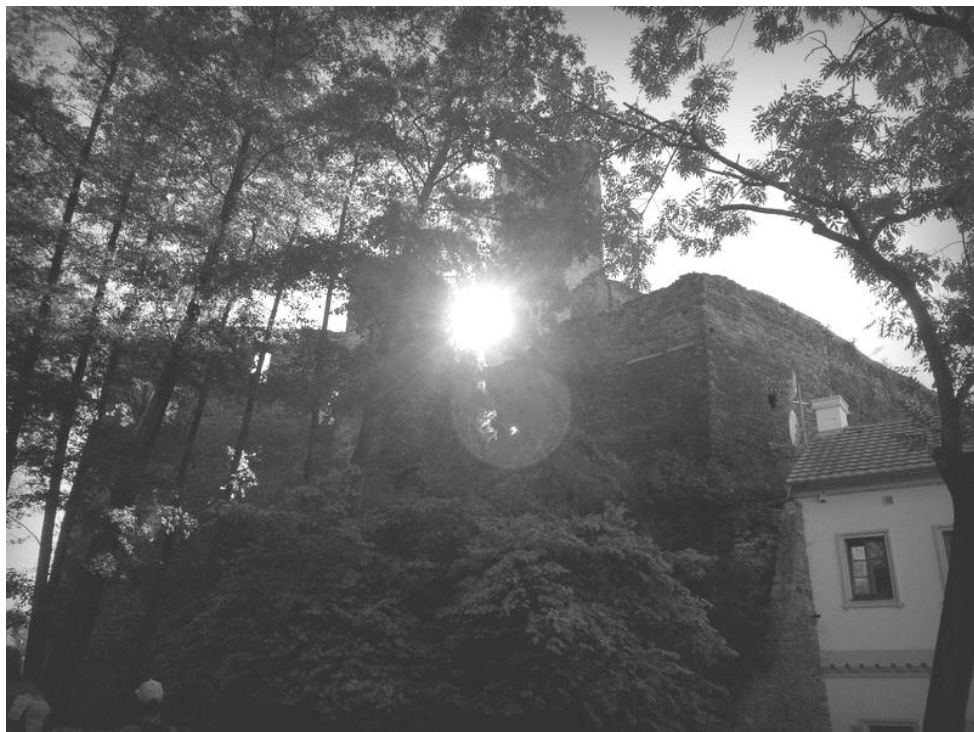
Zřícenina Okoř (z farního výletu 28. září 2015)