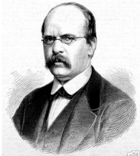
Johann Friedrich von Schulte musel Rakousko opustit

Obdobně jako v Německu se i v Rakousko-Uherském mocnářství začaly organizovat starokatolické výbory, zejména z řad měšťanstva a inteligence. Jejich zástupci se účastnili mnichovského kongresu v roce 1871, kde načerpali inspiraci z dění v sousední zemi, kde již bylo vytváření prvních starokatolických obcí o krok dál. Německé úspěchy podnítily i u nás mohutnou agitaci. Odpůrci dogmat organizovali velmi dobře navštívené tábory lidu, např. v Boru u Tachova, na vrchu Těhulí u Slaného nebo na Dubovém vrchu na Brdech. Na těchto táborech lidu promlouvali řečníci a kritizovali nejen nová dogmata, ale často i mocenské uspořádání církve jako takové a volali po větším zastoupení laiků a po dalších církevních reformách. Nejvýznamnějšími představiteli raného odporu proti novým dogmatům byli pražský profesor církevních dějin a práva Johann Friedrich rytíř von Schulte, který byl roku 1873 úřady donucen opustit Prahu a odešel do Bonnu, dále Friedrich Maasen, profesor církevních dějin v Grazu a ve Vídni, vídeňský katolický farář Alois Anton, který ve Vídni zorganizoval první starokatolickou obec, a varnsdorfský učitel náboženství Anton Nittel, který se stal zakladatelem starokatolictví na severu Čech.