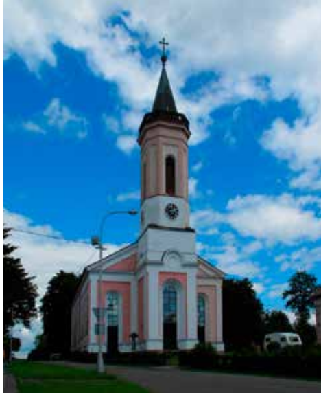
Varnsdorf se stal sídlem rakouského biskupství