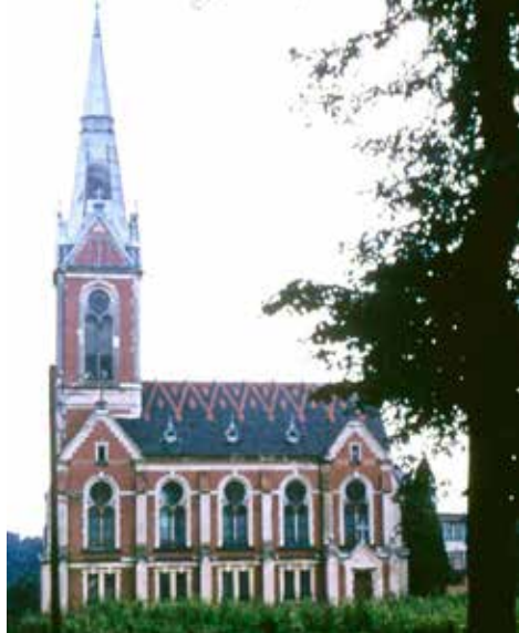
Kostel v Krásné Lípě nepřezžil komunistickou diktaturu

Tato nová církevní organizace pak byla 18. října 1877 uznána nařízením č. 99 říšského zákoníku a bylo povoleno vytvoření biskupství se sídlem nejprve ve Vídni, a od roku 1896 ve Varnsdorfu se třemi státem uznanými farními obcemi: Ried, Varnsdorf a Vídeň. Brzy následovalo vytvoření dalších obcí, které na sebe ovšem někdy musely brát podobu různých spolků, aby se vyhnuly státním represím. Oblíbenou metodou státní šikany bylo zamítnutí žádosti o vytvoření nové farní obce se zdůvodněním, že starokatolíci v daném místě nemají dostatečné finanční prostředky, aby zajistili důstojný výkon náboženských obřadů. Bylo jim vytýkáno, že slaví bohoslužby v pronajatých sálech, salóncích hotelů nebo tělocvičnách (proto například v Krásné Lípě římskokatolický tisk posměšně psal, že se starokatolíci schází v „chrámu svatého Kotrmelce“), na což starokatolíci reagovali stavbou řady vlastních kostelů. Tím se ale obce zadlužily a státní úřady mohly argumentovat tím, že nemají dost peněz na udržování farářského místa. Tahanice se státem o uznávání farních a filiálních obcí skončily až po roce 1918, protože nově vzniklá Československá republika