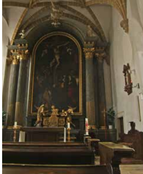
Videňští starokatolíci se začali scházet v kostele nejsv. Spasitele