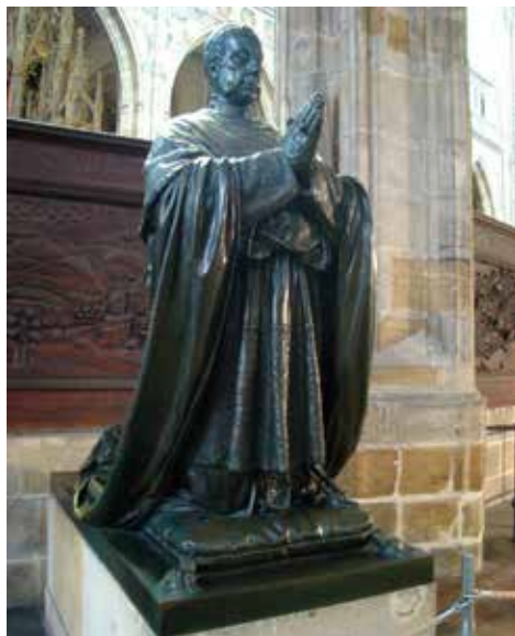
Kardinál Schwarzenberg se po koncilu papeži podřídil

silný jako v jiných částech německojazyčného světa. Pražský arcibiskup Bedřich kardinál Schwarzenberg byl před koncilem jedním z vůdců tzv. koncilní minority, tedy biskupů, kteří s dogmatizací papežské neomylnosti nesouhlasili, a několikrát v průběhu koncilu samotného otevřeně vystoupil se zásadními projevy. Nicméně ani tato vystoupení neměla kýžený efekt, a tak biskupové minority koncil raději opustili, aby předešli skandálu a nemuseli při závěrečném hlasování říci „ne“ papeži do tváře. Po vyhlášení dogmatu se kardinál Schwarzenberg i další biskupové postupně podvolili, i když s nechutí.