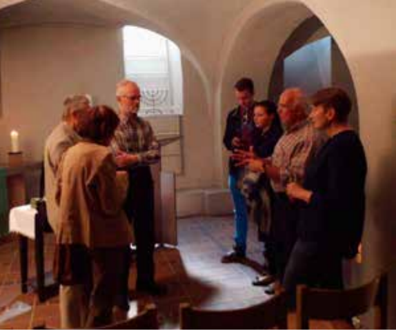
Návštěva tábořského faráře v partnerské farnosti v Sasku-Ānhaltsku