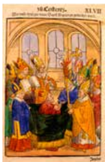
Vlevo papež Jan XXIII. Vpravo je Martin V. instalován jako papež. Kronika Kostnického koncilu Ulricha von Richental.

politickým dílem krále Zikmunda Lucemburského, úspěšného syna císaře Karla IV. Koncil byl svolán do města Konstanc (teprve později se mu v češtině začalo říkat „Kostnice“) na břehu Bodamského jezera, aby byl dostupný ze všech koutů Evropy. Jeho autorita se odvíjela od účasti církevních otců a politických autorit, a těch zde bylo v letech konání sněmu, 1414–1418, přítomno opravdu hodně. V českých dějinách jsou hlavní důvody svolání koncilu překryty kauzou Jana Husa, jehož soudní proces pokračoval před koncillem jako nejvyšší soudní instancí v církvi. Hlavním úkolem „svatého svolání konstanského“ bylo překonání papežského schizmatu, potření viklefismu a provedení církevních reforem.