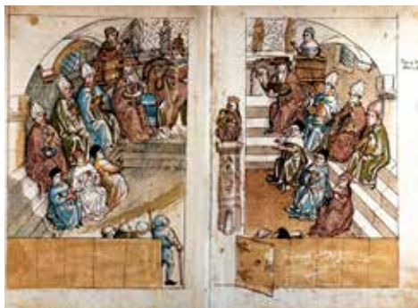
Zasedání Kostnického koncilu.

Pro morální stav církve na Západě bylo dvoj a posléze trojpapežství skutečnou pohromou. Všechny neblahé jevy v církvi, především duchovní formalismus a tendence k majetkovému vlastnictví, byly již od počátku 14. stol.