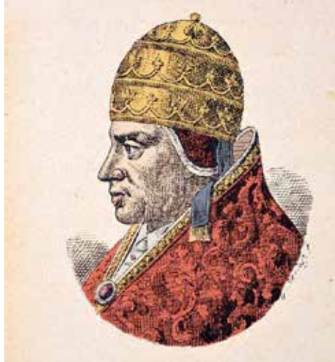
Papež Urban VI.

Papežské državy v Itálii byly však mezitím ohroženy, neboť v zemi vládl chaos lokálních válek knížecích rodů a městských států, uprostřed kterého se snažila prosadit revoluční myšlenka znovunastolení velikosti anticlého římského státu a vlády Říma. Tu hlásal v Římě raně renesanční tribun lidu Cola di