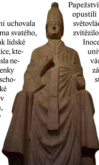
Pyšný papež Bonifác VIII., socha z italské Florencie, konec 13. stol.

Inocenc III. dovršil projekt papežské univerzální církve. Zamezil vměšování světské moci do církevních záležitostí. Od té doby se papežové stali skutečnými pány nad celou církví, vydávali nové církevní zákony, udělovali současně dispensy a privilegia (již od doby Inocence III. je známo rčení