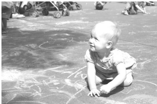
Malování křídami bavilo i ty nejmenší...