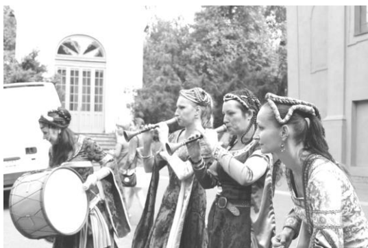
Hrálo se k tanci i poslechu...