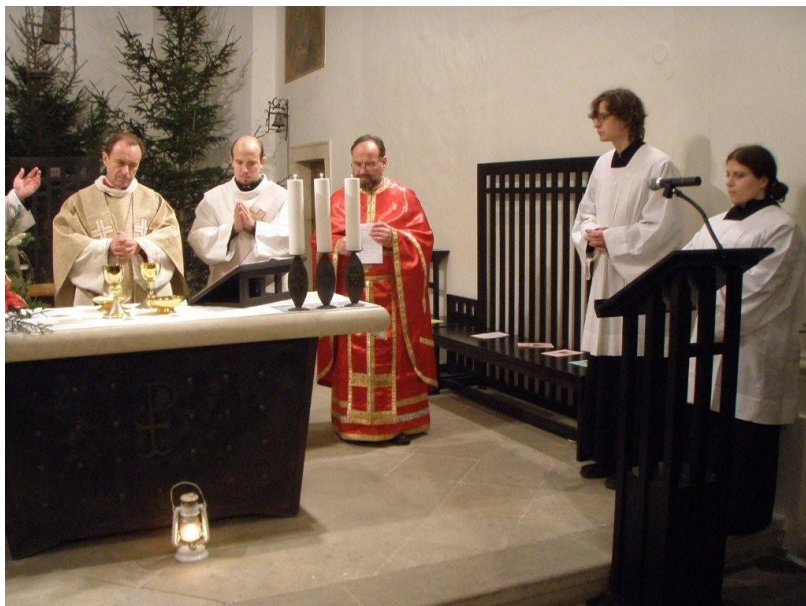
Půlnoční eucharistická slavnost 2008