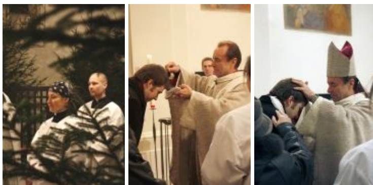
Svátek Křtu Páně 2009

Křížovatka – měsíčník. Vydává Farní obec starokatolické církve v Praze.