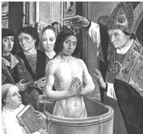
Křest krále Chlodovika

Pokud chceme pochopit dění v západní Evropě v 6. - 10. st., je třeba mít stále na zřeteli, že docházelo ke střetu dvou kultur, které se navzájem ovlivňovaly, až splynuly v jednu novou středověkou kulturu. I když Germáni měli vlastní právo, náboženství, světonázor a moc, ve střetu s antikou a helénismem byla jejich kultura, vzdělanost a v důsledku i organizovanost na nižší úrovni. A právě po rozpadu Západořímské říše byla katolická církev jedinou nositelkou antického dědictví, což si asi uvědomil franský král Chlodovik, když nejspíše r. 496 přijal v Remeši křest z rukou katolického biskupa Remigia. Tím